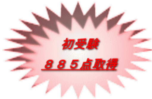
W. S 様